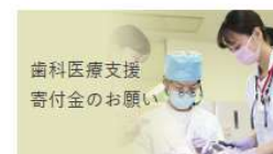
歯科医療支援 寄付金のお問い合わせ