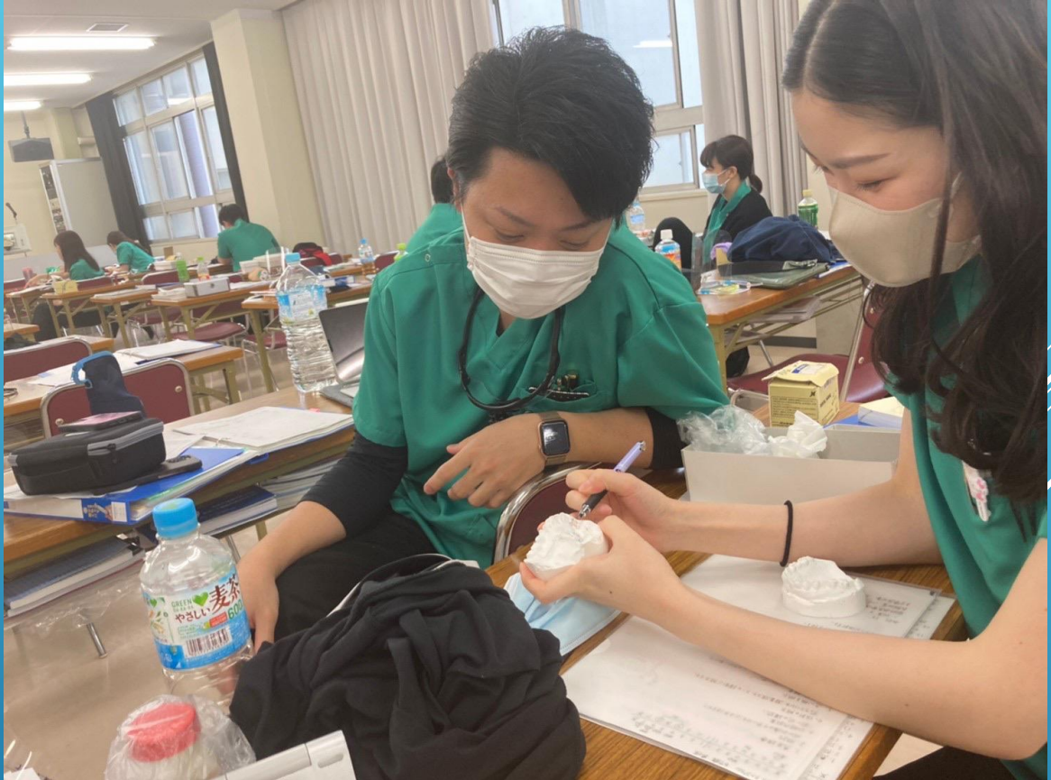
AGUD Residency Program 2023