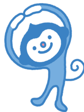
日本糖尿病協会マスコット マールくん